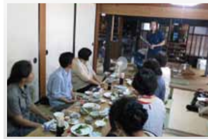
先進地の取り組みの説明から、新しい知識、農家民泊のノウハウを学んだ参加者のみなさん。

第2回の「つどい元気いち」では、農家民泊の先進地、鳥取県智頭町の視察へ。住人5人、アクセス不便、特別なものはなにもない...それでも多くの