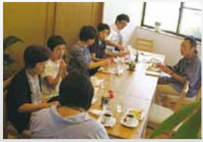
盛り上がる意見交換。「地区それぞれの味、昔ながらの地域の食を再現して試食しよう!」との声も。

第3回の「つどい元気いち」では、農家民泊に興味をお持ちの方を対象に、農家民泊についての小勉強会、情報交換やさまざまな意見交換が行われました。前半は、農家