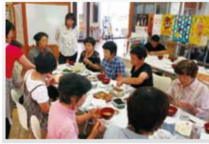
地域による食材の違い、ご家庭それぞれの味の違い、但東の郷土食をそれぞれ楽しめました。

プレ開催を経て、7月15日(水)、初めての「つどい元気いち」が開催されました。当日は10人の方が